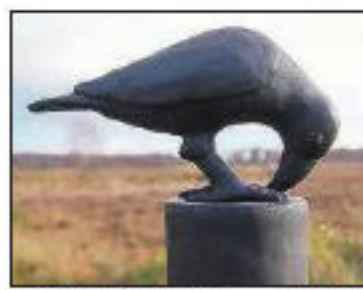
Werk van Lia van Rhijn.

brons, klei of glas. Met een typerende houding, de reflectie van het licht op veren, de blik. Een portret van de vogel als individu. 'Aan vogels worden allerlei menselijke eigenaardigheden toegedicht. Door de hele kunstgeschiedenis vertolken afbeeldingen van vogels menselijke eigenschappen. De uil betekent soms de domheid zelf. Zie afbeeldingen van Jeroen Bosch en Jan Steen. In de oudheid is de uil de begeleider van de godin Athene en symboliseert hij juist wijsheid. In wapens en vlaggen speelt de mythische adelaar een belangrijke rol. De adelaar is de metgezelle van de oppergod Zeus en het symbool van Johannes de evangelist.'